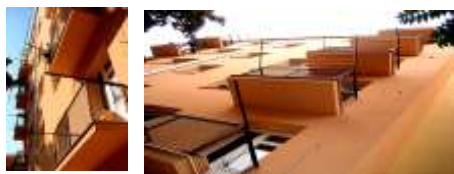
Zateplení dvorní fas. BD Pellicova 3a v Brně Výměra: 500m 2 , Systém: Ceretherm Premium Cena: 850.000,00Kč, Provedena rekonstrukce balkonů a KCE Investor: BD Pellicova 3a