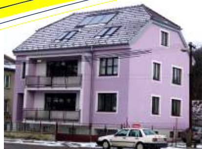
Zateplení RD Nerudova v Kuřimi Výměra: cca. 250m 2 , Systém: Ceretherm Premium Realizace: 2010 Cena: cca. 400.000,00Kč Investor: majitelé RD