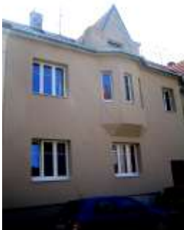
Zateplení BD Tišnovská 82 v Brně Výměra: cca. 300m 2 Systém: Ceretherm Premium Realizace: 2011 Cena: cca. 350.000,00Kč Investor: majitelé BD v zastoupení BD Ezra reality s.r.o. Certifikovaný systém pro program zelená úsporám.