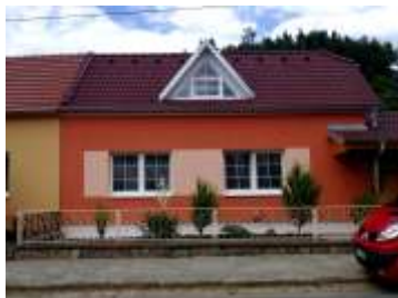
Zateplení RD v Lelekovicích Výměra: cca. 50m 2 Systém: Ceretherm Premium Realizace: 2011 Cena: cca. 50.000,00Kč Investor: n. Buchta