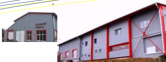
Zateplení objektu fa. Ohýbané profily a.s. Rojetín Výměra: 750m 2 , Systém: Ceretherm Premium + PUR panely Cena: 1.050.000,00Kč Investor: Ohýbané profily a.s., Provedení včetně oplechování.