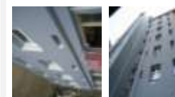
Zateplení BD Jana Uhra 18- dvůr Výměra: 730m 2 , Systém: Ceretherm Premium Cena: 1.250.000,00Kč Investor: Ezra reality, Projekt: Zelená úsporám Provedení vč. lakovaných parapetů, svodů.....