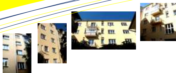
Zateplení dvorní fas. BD Pellicova 3 v Brně Výměra: 420m 2 , Systém: Ceretherm Premium Cena: 650.000,00Kč Investor: BD Pellicova 3